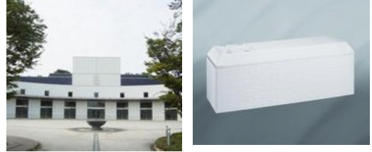
ウイングホール柏斎場 お棺